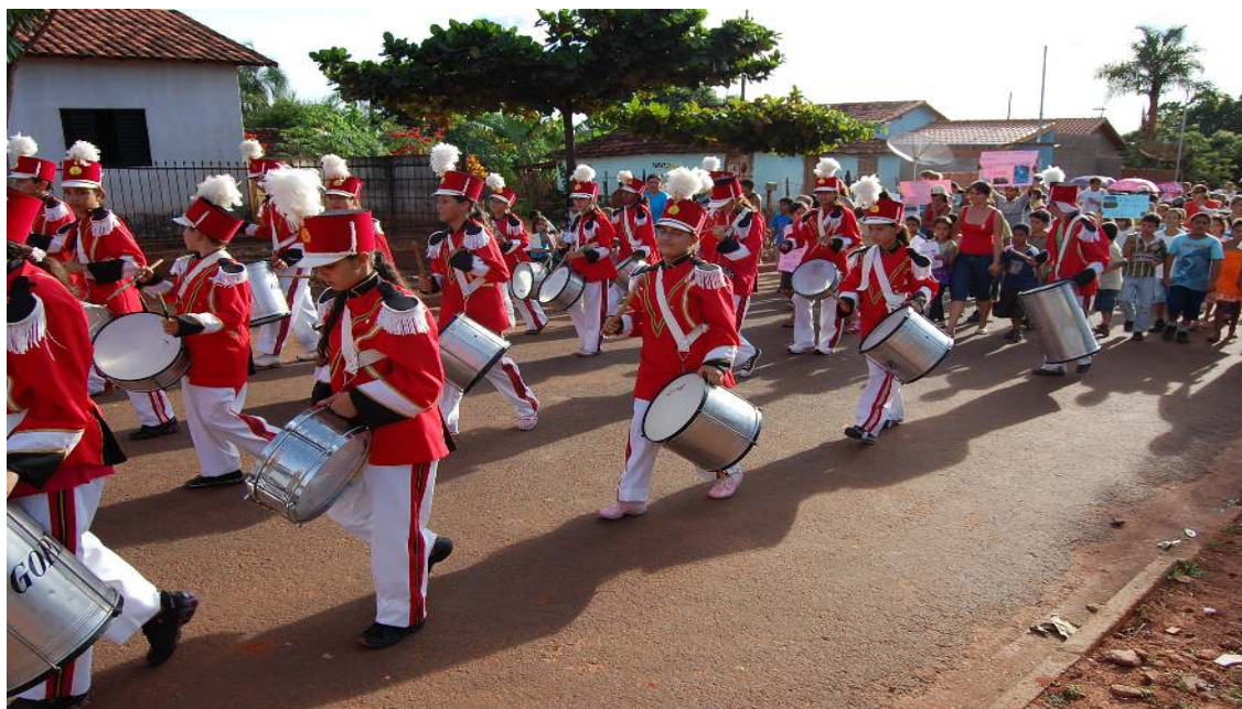
FANFARRA DE LIMEIRA DO OESTE