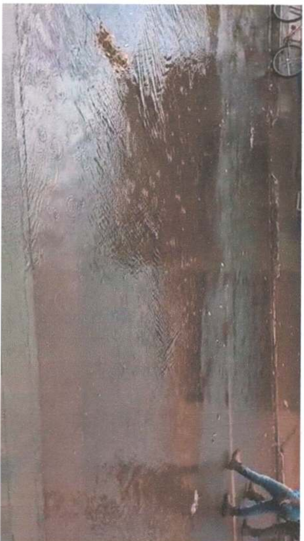
Avenida Minas Gerais esquina com Rua José Florindo de Queiroz