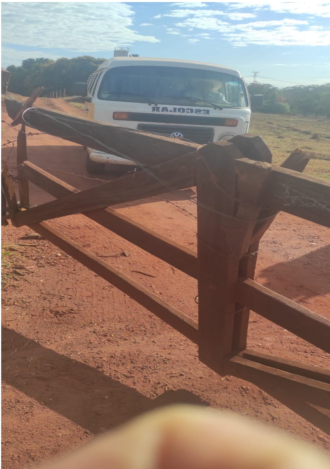
PORTEIRA NA ENTRADA DA ESTRADA.

PREFEITURA MUNICIPAL DE LIMEIRA DO OESTE CNPJ 26.042.556/0001-34 Rua Pernambuco, N°780 - Centro - Fone: (34) 3453-1700 - Fax: 3453-1713 - CEP 38295-000